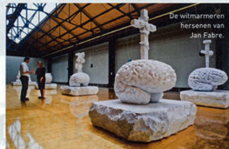
De witmarmeren hersenen van Jan Fabre.

Plan uw uitstappen met trein, tram of bus. Voor dienstregelingen en brochures, raadpleeg http://www.rail.be/main/NL