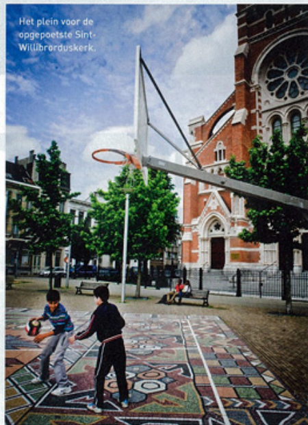
Het plein voor de opgepoetste Sint-Willibrorduskerk.

Van Extra City ben je in een vloek en een zucht in dé hotspot van Antwerpen 2060: Park Spoor Noord. Een paar jaar geleden nog een grauw en desolaat rangeerstation, nu een groene oase waar voetbal, cricket en kubb gespeeld worden. Kindertjes in alle kleurschakeringen joelen in de dansende fontein van het stadsstrand, jongeren breakdansen, skaten en halen acrobatische toeren uit op hun bmx-fietsen. Bij zomerbar Cargo zijn de steenovenpizza's en mojito's zeer in trek. Iedereen komt joggen, zonnekloppen, picknicken en barbecueën: fietskarrenvolk, jonge Marokkaanse middenklassegezinnen,