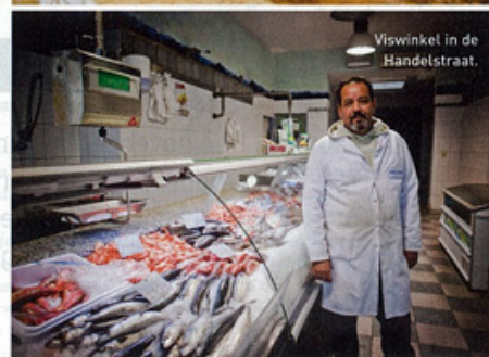
Viswinkel in de Handelstraat.