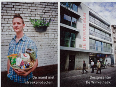
De mand met streekproducten.