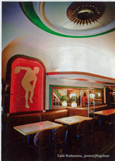
Café Kiebooms, jarenvijftigsfeer.

Op het plein is er intussen al wat meer beweging. Opvallend is de aanwezigheid van zwarte Afrikanen. In het Brusselse Matongé zijn er veel meer dan in Antwerpen, maar wat daar ontbreekt, is een centraal plein. Eigen aan de Afrikaanse cultuur is dat mensen zo'n plein opzoeken om anderen te ontmoeten of informatie in te winnen over land- en streekgenoten. Wie hier 'rondhangt', doet dat dus niet noodzakelijk met slechte bedoelingen. Overigens is deze wijk de enige in Antwerpen waar er nultolerantie geldt. Tenzij ze een speciale vergunning hebben, moeten de cafés om één uur sluiten en op straat mag er geen bier gedronken worden. Behalve tijdens een van de vele culturele events die er tegenwoordig georganiseerd worden. Of dat zo democratisch is, is maar de vraag, maar de laveloze Carapilsdrinkers die vroeger het straatbeeld bepaalden, zijn in ieder geval verkast. Van de vele danscafés die het De Coninckplein vroeger rijk was, weerstond één de tand des tijds: Café Kiebooms, genoemd naar de toenmalige eigenaar/accordeonist. Wie op huisnummer 18 het authentieke interieur binnenstapt, heeft het gevoel door de teletijdmachine van professor Barabas naar de vroege jaren vijftig gekatapult-